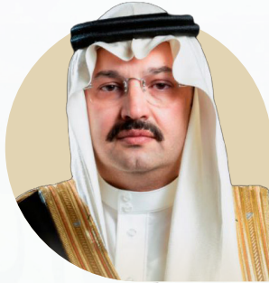
صاحب السمو الملكي الامير

تركي بن عبد الله بن عبدالعزيز آل سعود أمير منطقة عسير ورئيس هيئة تطويرها حفظه الله