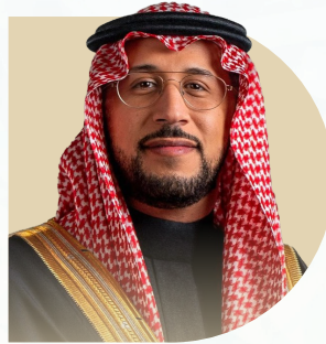
صاحب السمو الملكي

يوسف بن عبد الله بن بنين وزير التعليم حفظه الله