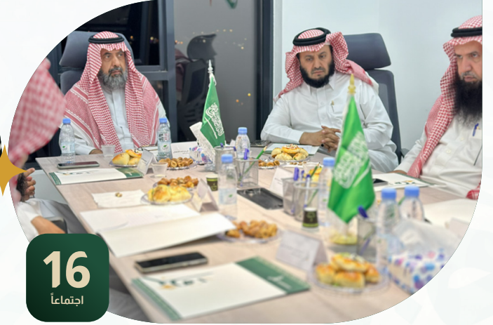
اجتماعات الجمعية العمومية